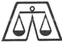
(一社)静岡県計量協会